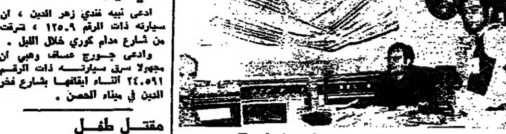
وفي الضمام مقلنا في ارضي المحل وعلى الرصيف

وقدر الخبير الحاج الهام كريمة اضرار بصورة تقديرية بواقع مليون ليرة ، وقال ان الاجرة والتكوير التي اخطاها التجار في محل الشيطيني تساوي ، حسب مسعر الشيطيني